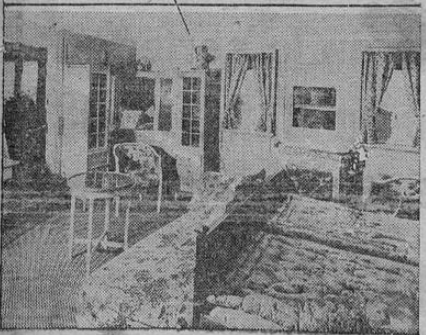
Aquí vemos el apartamento ("suite") del vapor BERENGARIA, en el cual han viajado importantes personas de la actualidad. Construido originalmente para el Kaiser, ha sido ocupado por el príncipe de Gales, el rey Alberto, el primer ministro Mac Donald y otras muchas personalidades