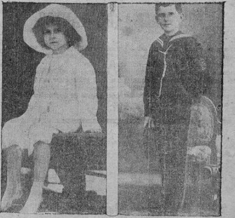
En los archivos reales de Bruselas y Roma han sido encontradas estas dos fotografías, que muestran a la princesa María José y al Príncipe Humberto en sus primeros años, y a las cuales da actualidad la reciente boda de dichos príncipes