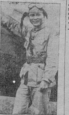
El general Chang Wai Jung, jefe de la aviación militar china, se encuentra de visita en los Estados Unidos, estudiando los mejores métodos para aplicarlos a esa ciencia en su país