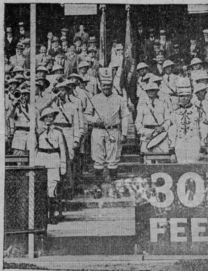
La banda de la Legión Americana dio un concierto en honor del famoso jugador de base ball, Babe Ruth, en el Yankee Stadium de Nueva York, y aquí la vemos temporalmente dirigida por el Bambino, quien encontró alguna diferencia de la liviana batuta a su pesado bate

Y mientras la novia burlada espera, y el galán huye, otra de las novias se pasa llorando por el truncamiento de su romance amoroso.